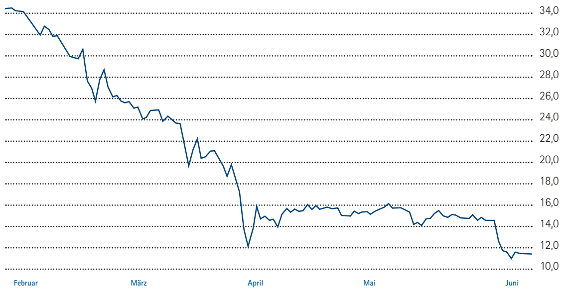
Entwicklung der publity-Aktie im ersten Halbjahr 2018 (Kurs in Euro)